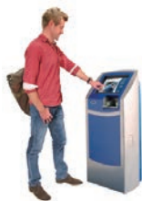
自動化ゲート専用機 (Kiosk)